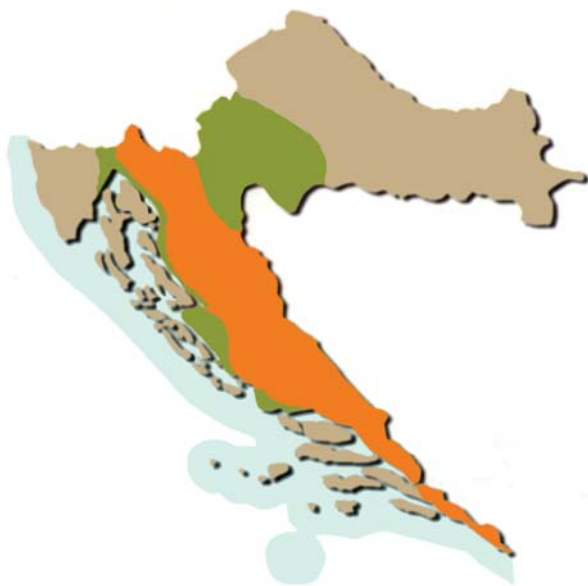
Rasprostranjenost vuka/Wolf distribution

Područje na kojemu se vukovi povremeno pojavljuju naslanja se na Dinaride, sa sjeverne i južne strane, a zauzima 17,7% kopnene Hrvatske.